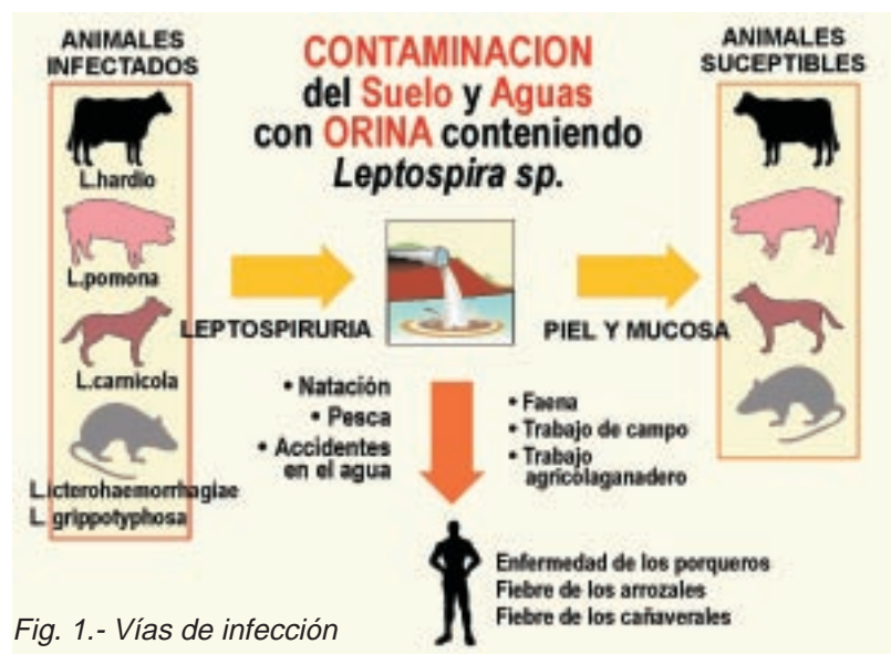
Fig. 1.- Vías de infección

La transmisión entre los animales puede realizarse a través de agua, pasturas o raciones contaminadas con orina, descargas uterinas o fetos abortados.