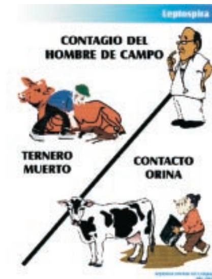
Fig. 2: Fuentes de infección en humanos

La forma más frecuente de transmisión al hombre consiste en la exposición a orina, sangre, tejidos u órganos de animales infectados o indirectamente a través del contacto con agua, suelo húmedo o vegetación contaminados con orina de animales infectados.