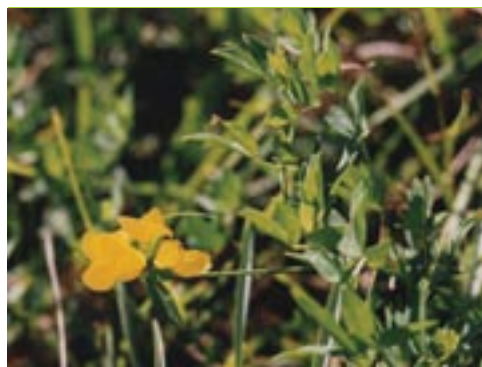
Lotus glaber -ex tenuis