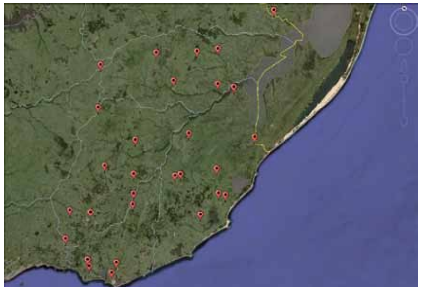
Figura 1. La distribución de las actividades en el territorio

El ámbito para esa articulación fueron los CAD (Consejos Agropecuarios Departamentales) y las Mesas de Desarrollo. También hubieron a nivel de la regional ámbitos específicos de coordinación institucional e intercambio técnico con INIA Treinta y Tres y con el proyecto de Producción Familiar de INIA Las Brujas que está trabajando en Rocha.