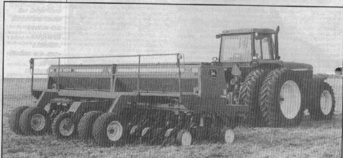
Modernas sembradoras con eficientes sistemas de siembra, permiten reducir los tiempos operativos y así los tractores prolongan su vida útil