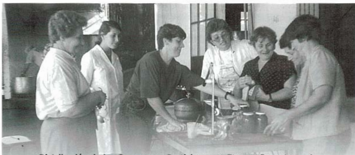
Distribución de los Grupos que Participan por Etapa y Departamento