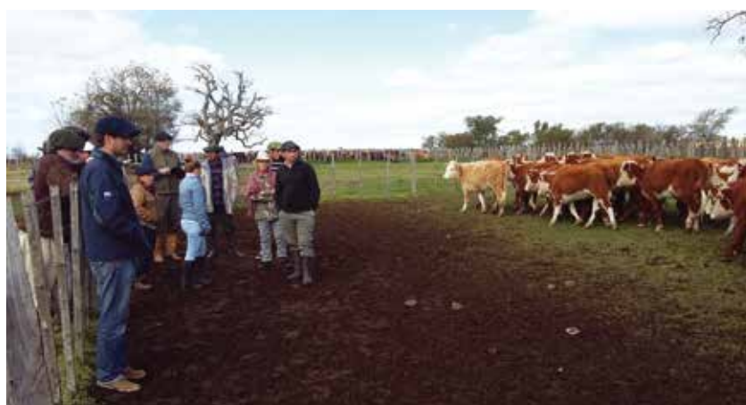
Foto 4. Caracterización de los animales a nivel de categoría (especie, categoría, peso vivo, condición corporal, objetivos, demanda de pasto).

Con referencia 1° de diciembre de 2017 se realizaron las mediciones de pasto y ganado para poder proyectar el verano 2017/2018. En el cuadro 2 se presentan los datos agrupados de los 11 predios que