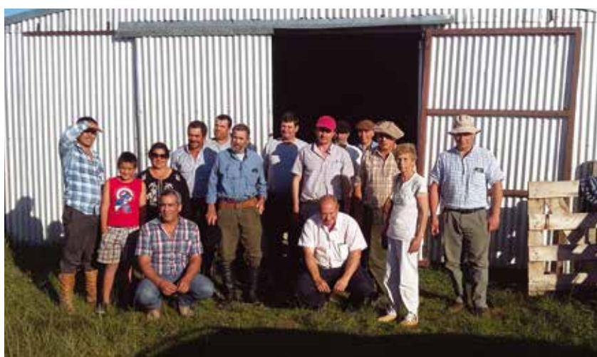
Foto 1. Actividad de nivelación de conocimientos en el Centro de Capacitación Martín Fernando Martinicorena, Paso Farías, Artigas. 8, 9 y 10 de Agosto de 2017.