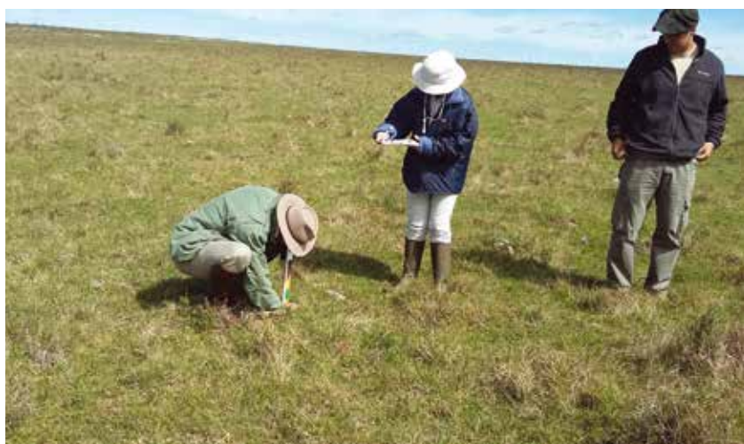
Foto 2. Medición de la altura al inicio de la estación, el proyecto pretende sea una habilidad adquirida por los productores.