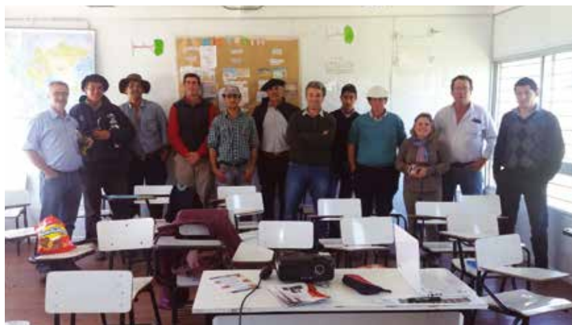
Foto 3. Taller para discutir la situación del predio monitoreado, con los aportes de otros productores y técnicos

Del total de los 11 predios, al momento de realizar la medición en fecha próxima al 1° de setiembre, el 36% presentaron oferta alta, el 55% oferta media y el 9%