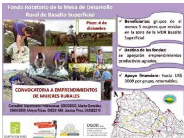
Afiche de convocatoria de Fondo Rotatorio