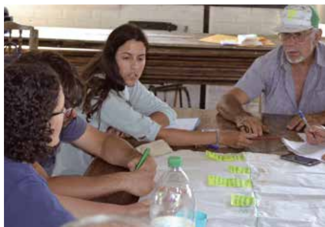
Actividad de evaluación del Plan de Trabajo, local de la AFR Valentín.