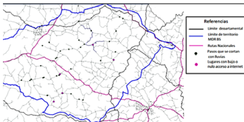
Mapa 2. Territorio de MDR BS, señalización de pasos cortados y lugares con bajo o nulo acceso a internet.