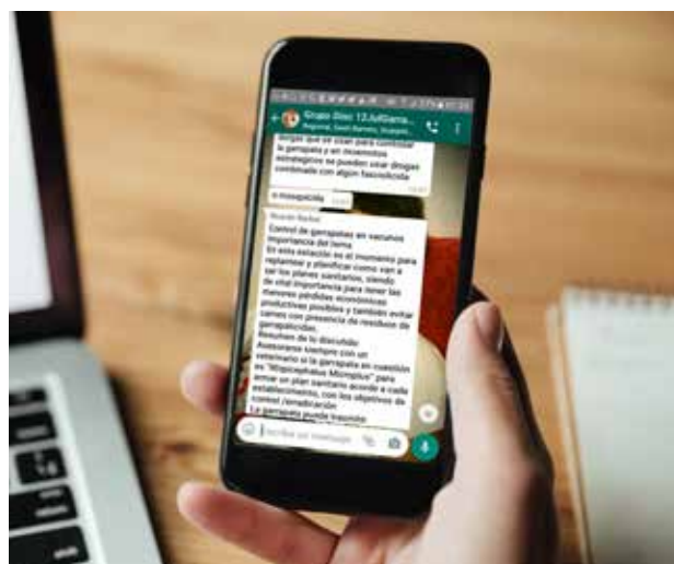
Whatsapp como medio para la Extensión.