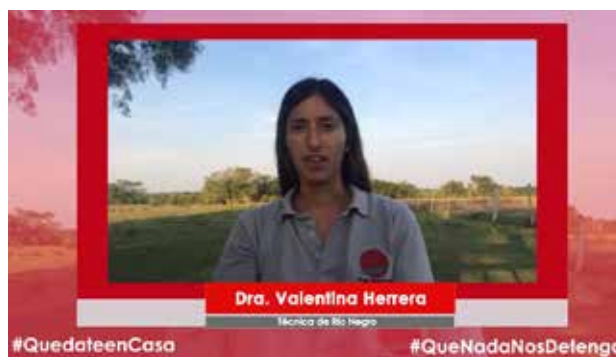
Difusión de videos informativos a través de las redes sociales.