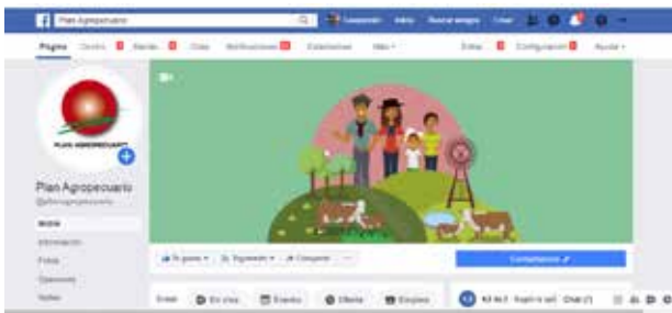
Transmisión de Encuentros virtuales en canal de Youtube y página de Facebook.