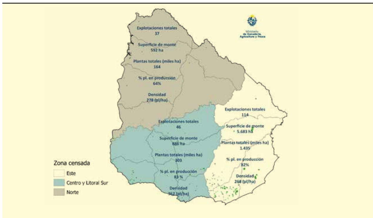
Mapa 1. Distribución de las explotaciones, superficies y plantas de olivos según región.