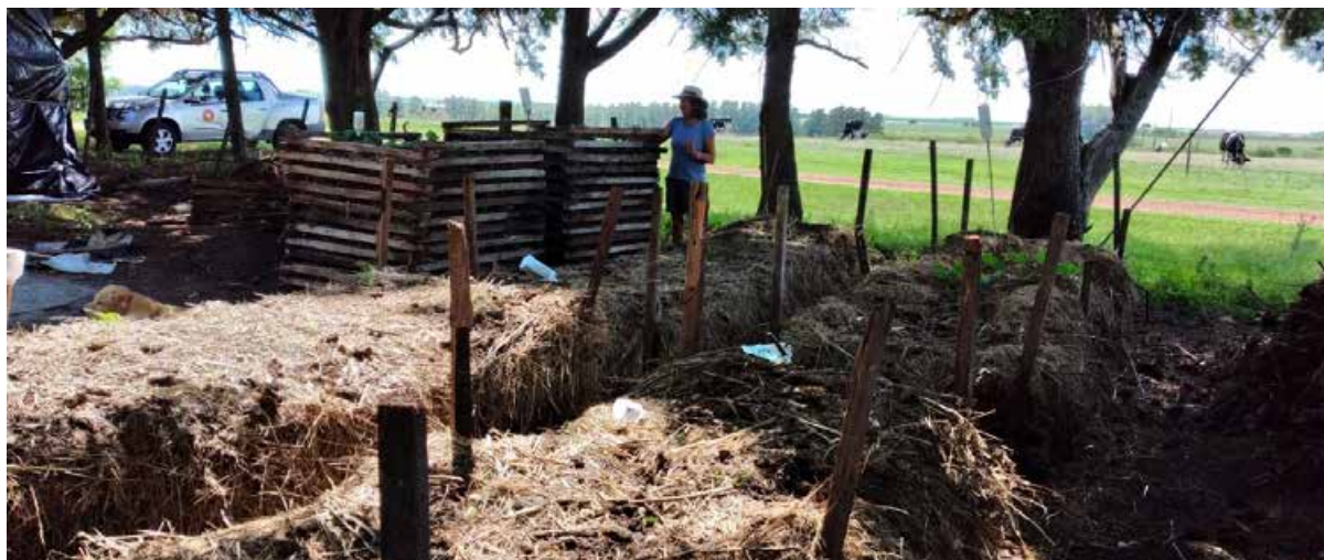
Foto 2. Área de producción de compost, integrado por restos de podas, restos vegetales, estiércol de vacunos, restos orgánicos de la cocina, es una fuente de abono para todos los cultivos del sistema.

vir al campo y trataron de hacer todo de maravillas, pero no te daban los números (invertir en el campo, producir, vender, pagar deudas y a su vez mantener una familia) ... Son historias de créditos, por ejemplo, en el año 2002-2003 vendíamos todo y no pagábamos... En esos años comenzamos a refinanciar y poco a poco a achicar el pasivo. También cuando comenzamos con la lechería asumimos una deuda que parecía impagable y si hay algo que me doy cuenta es que éramos muy arriesgados