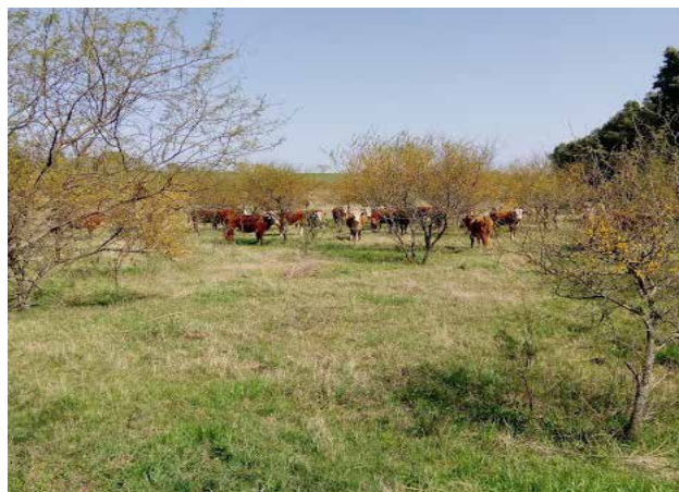
Foto 3. Vacas de cría pastoreando campo natural, se intenta favorecer el silvopastoreo con sombra de espinillos, algarrobos, sauces y especies nativas arbóreas. sistema”