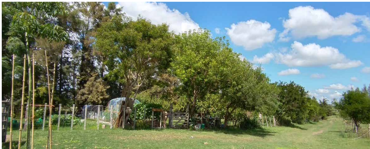
Foto 5. Área de producción de frutales, al fondo se observan las cortinas de árboles "piel de protección y abrigo del sistema"