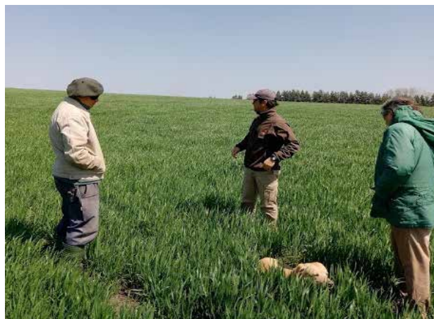
Foto 4. Recorriendo cultivo de trigo biodinámico, sin aplicación de agroquímicos de síntesis.

Para nosotros es imposible tomar el pastoreo racional Voisin estricto, dada la diversidad de suelos que existe en una misma parcela, por la necesaria rotación con cultivos, por ejemplo, querés hacer fardos, imagínate tener que mover todo lo fijo... nosotros agarramos levantamos el hilo móvil y tenemos un área grande... Por otro lado, lo que implica la logística de hacer reservas de forraje, contratar equipos. Ningún contratista viene por una hectárea., entonces es casi imposible hacerlo estrictamente como se propone en nuestra situación. En consecuencia, hablamos del PRU: Pastoreo racional a la uruguaya...Cada uno tiene un sistema que se debe adaptar a los recursos disponibles en ese lugar, a la familia, a los recursos humanos, y, en definitiva, a lo que es posible hacer; intentamos disfrutar y hacer lo que nos gusta.