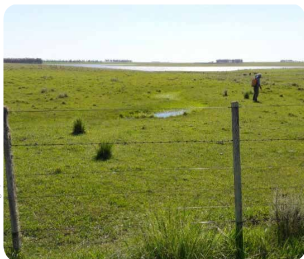
Foto 3. Focos insipientes de Capim Annoni en potrero

En Río Grande Do Sul, la investigación ha demostrado que en potreros con más de 70% de suelo cubierto por Annoni se dejan de ganar alrededor de 40 kg de carne por hectárea y por año. Si trasladamos esta cuantificación, solo a título demostrativo, a sistemas criadores sobre basalto, se aproxima al 50% de la producción de carne por ha/año.