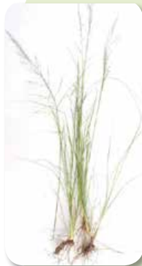
Foto 4. Planta de Capim Annoni.