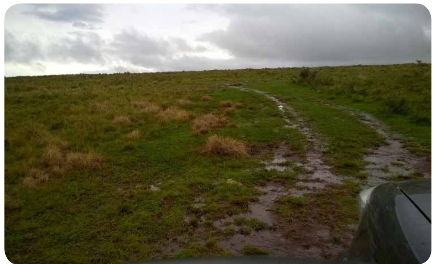
Fotos 6 y 7. Escobilla química haciendo contacto con planta de Capim y potrero con infestación insipiente ya tratado con escobilla química.