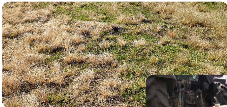
Fotos 8 y 9. Campo tratado con máquina de alfombra y máquina de alfombra

poración de especies forrajeras productivas para cubrir el suelo posteriormente a la eliminación de las plantas de Annoni. Es claro que en suelos superficiales como los del basalto, la posibilidad de recuperar la productividad del tapiz en base a pasturas sembradas, es una utopía. Por lo cual la mejor forma de control es la prevención.