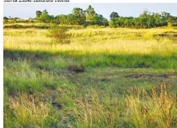
Espécie invasora capimannoni forra pasto no Rio Grande do Sul