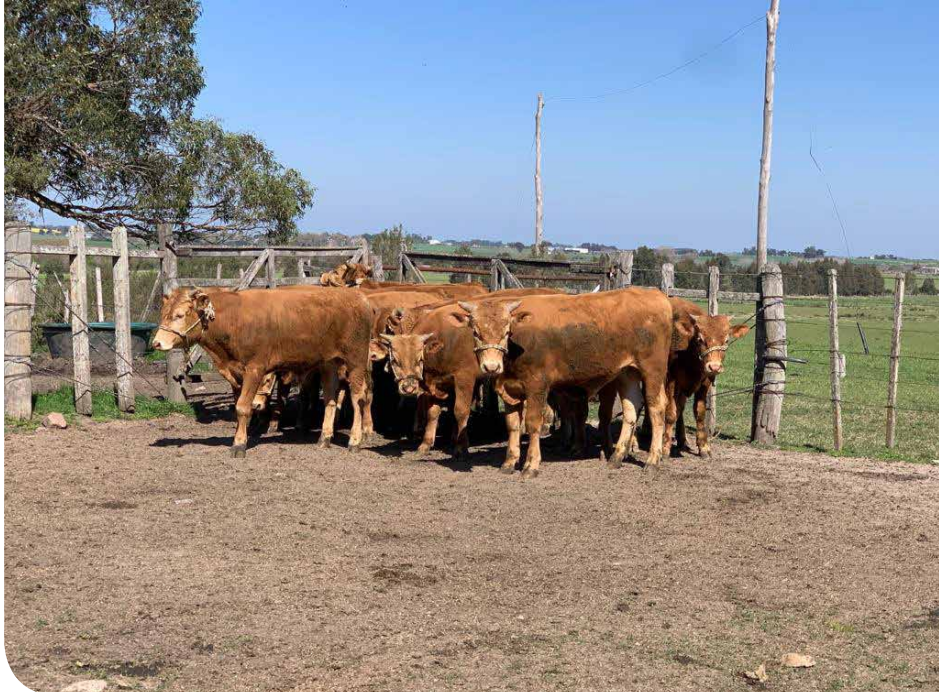
Foto 2. Novillos Wagyu colorado