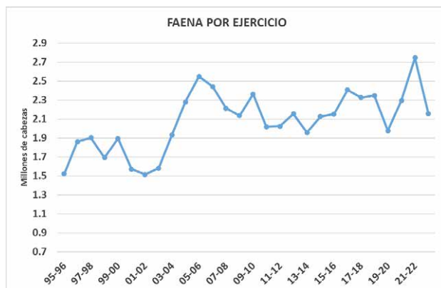
Gráfica 1. Evolución de la faena de vacunos para el período 1995-1996 al 2022-2023. Fuente: elaborado en base a datos de INAC.

El otro factor que contribuye a la extracción es la exportación de vacunos en pie, que superó levemente las 130 mil reses (132.340 vacunos). La gráfica 2 nos muestra cómo han sido los diferentes semestres de años anteriores, donde se marca el pico de los años 2017 y 2018, con el máximo de más de 400 mil cabezas en 2018.